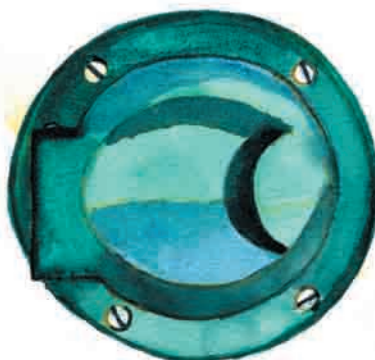
Du lämnar in den till Somnusmaskinen.