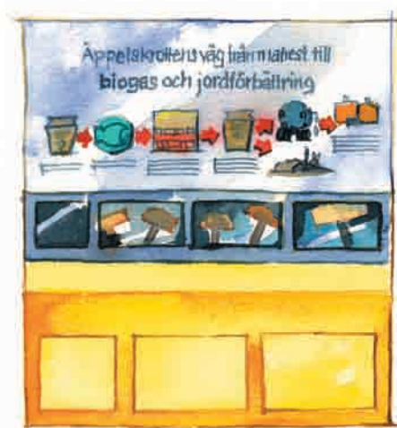
Genom en finurlig process torkas det mesta av vattnet bort och kvar blir bara torrkonserverad näring och energi.