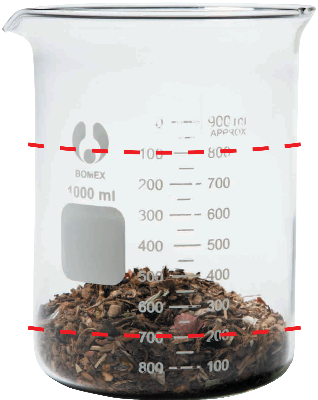
Matavfallet har reducerats till en fjärdedel av dess ursprungliga vikt och volym. Här ligger vilande kraft.